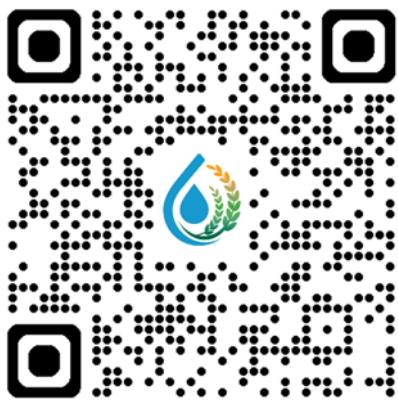
公版資料夾與命名說明連結 Qrcode